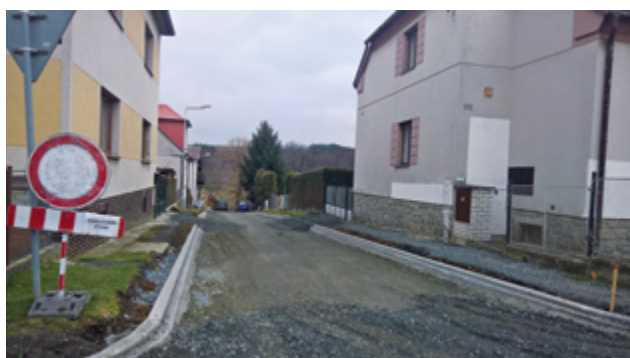
Prodloužení vodovodu v Blovicích, lokalita Hájek, dotace: 2 672 363 Kč