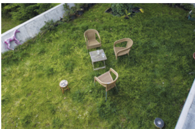
Zateplení domu se zelenou střechou v Prostějově, dotace na zelenou střechu: 90 000 Kč