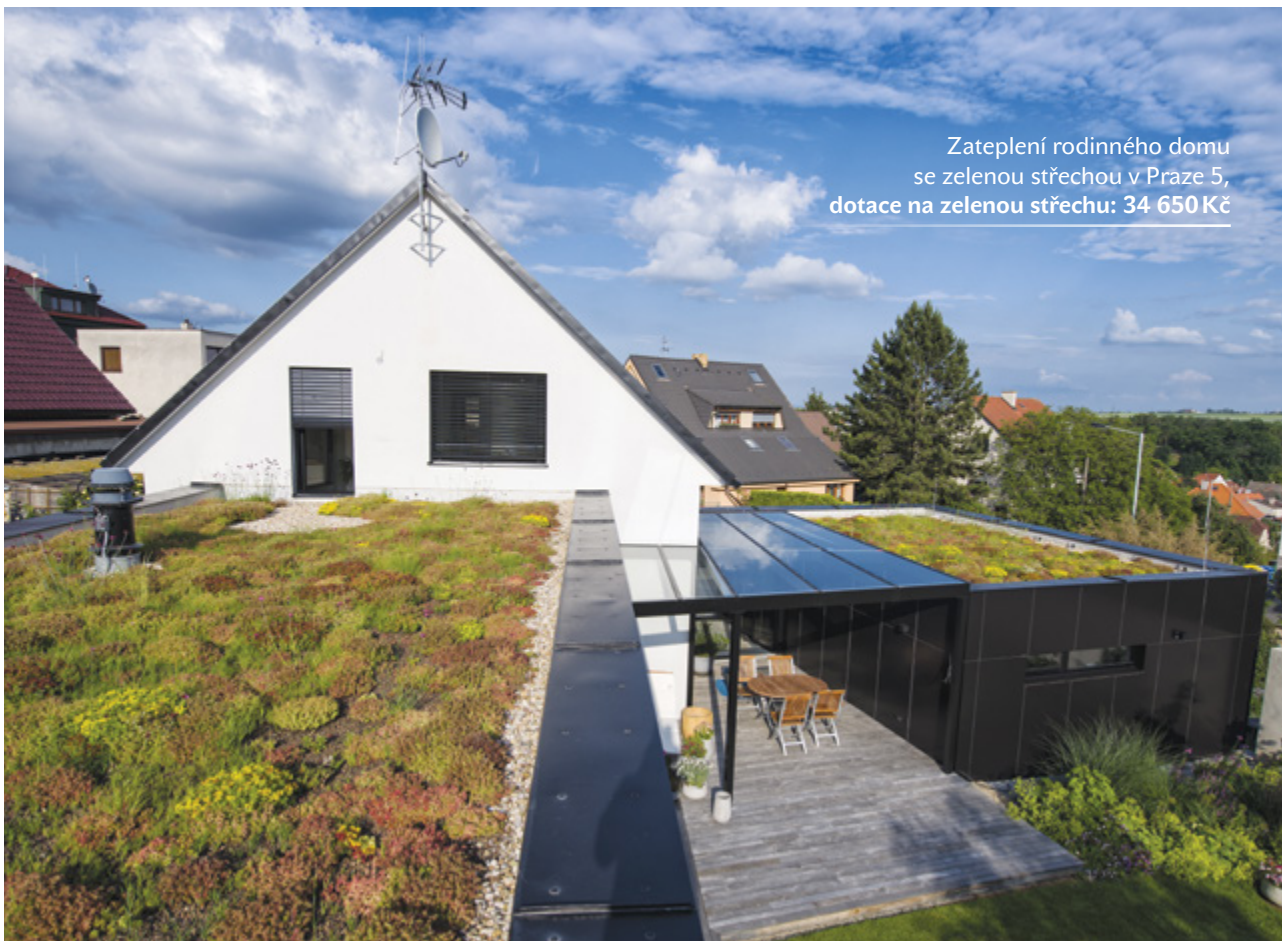
Zateplení rodinného domu se zelenou střechou v Praze 5, dotace na zelenou střechu: 34 650 Kč