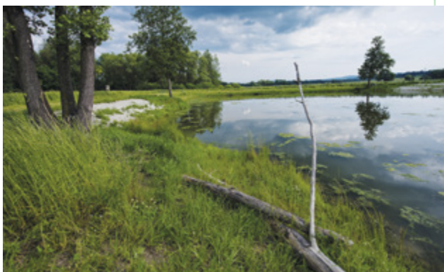
Revitalizace odstavných ramen a tůní v nivě Otavy, dotace: 6 662 396 Kč