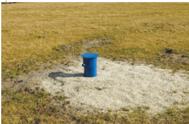
Libínské Sedlo – posílení zdroje, dotace: 186 340 Kč