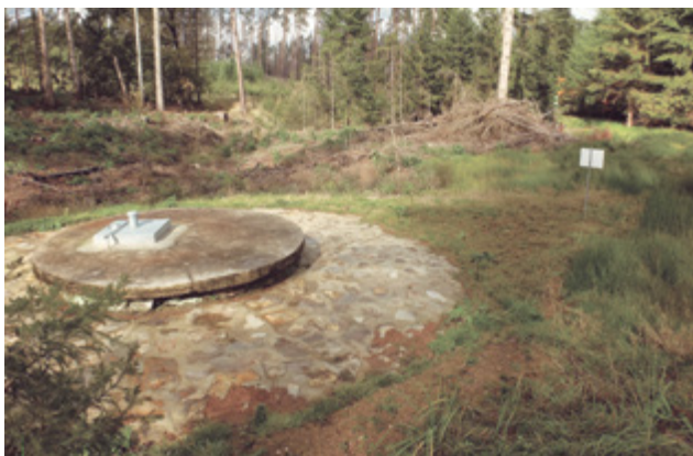
Vystrojení hydrogeologického vrtu a jeho napojení na vodovodní systém obce Hříšice, dotace: 2 191 174 Kč