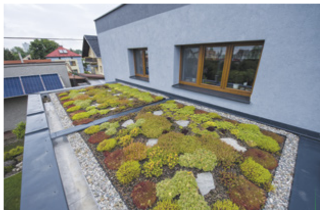
Zateplení rodinného domu se zelenou střechou ve Frýdku-Místku, dotace na zelenou střechu: 15 070 Kč