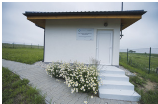
Vrchy – revitalizace vodního zdroje HV-1 a úprava pitné vody, dotace: 3 000 000 Kč