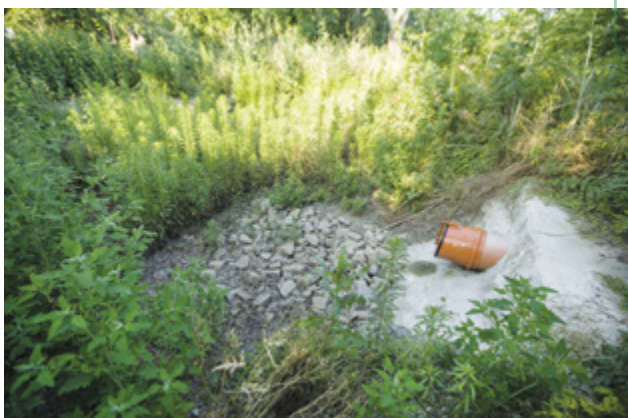
Lužice – dešťová kanalizace v ulici Dvorní, dotace: 617 082 Kč