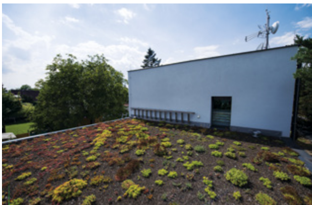
Výstavba rodinného domu v Praze 4, dotace na zelenou střechu: 111 750 Kč