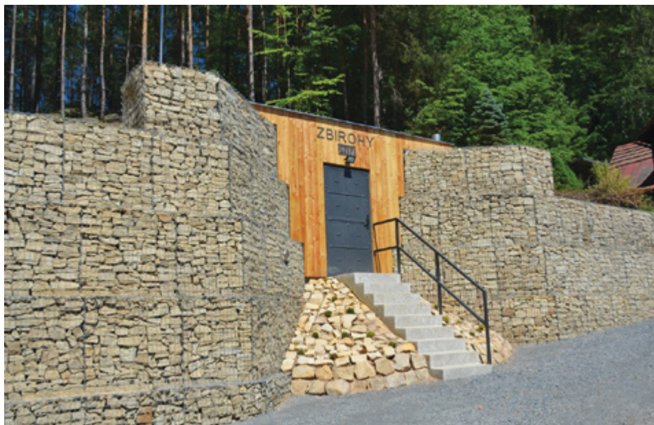
Obec Rakousy – Rozšíření akumulace vodního zdroje (vodojem Zbirohy), dotace: 1 851 048 Kč