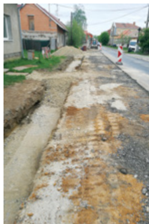
Čejkovice – splašková kanalizace a ČOV, dotace: 14 295 721 Kč