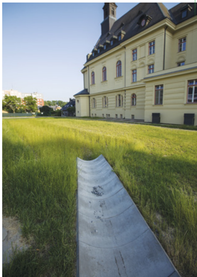
Vybudování zasakovacího průlehu s rýhou u parkoviště v Bruntále, dotace: 1 253 742 Kč