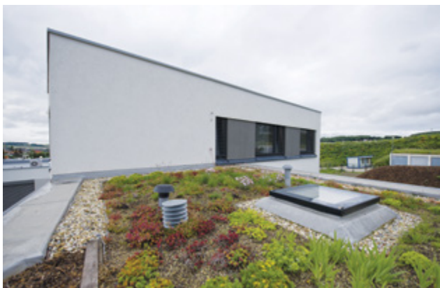
Výstavba rodinného domu se zelenou střechou v Mníšku pod Brdy, dotace na zelenou střechu: 22 000 Kč