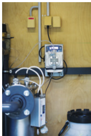
Posílení vodovodu a úprava podzemní vody z vrtu v obci Rajnochovice, dotace: 1 755 000 Kč