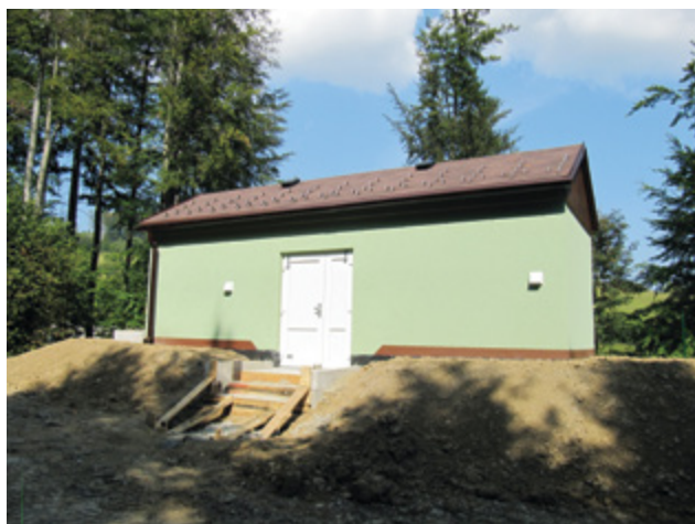
Rozšíření vodovodu Hošťálková pomocí dvou nových vrtaných studní, vybudováním přivaděčného řadu a nového vodojemu, dotace: 3 924 864 Kč