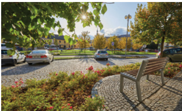
Revitalizace funkčních ploch a prvků sídelní zeleně v Lošticích, dotace: 2 520 190 Kč