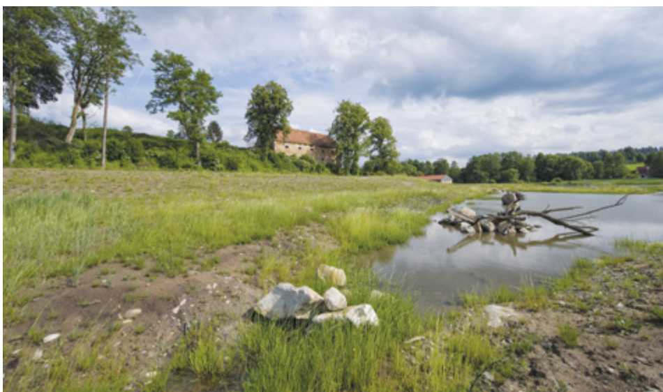
Výstavba tůní a oprava Náglovy stezky u obce Kostelní Myslová, dotace: 5 192 180 Kč