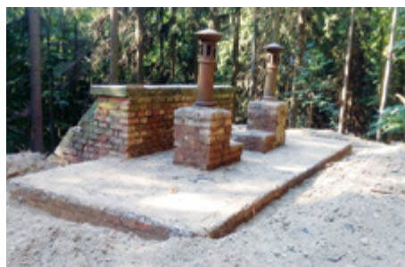
Rozšíření SV Vyškov, II. etapa, větev Švábenická, dotace: 53 898 871 Kč