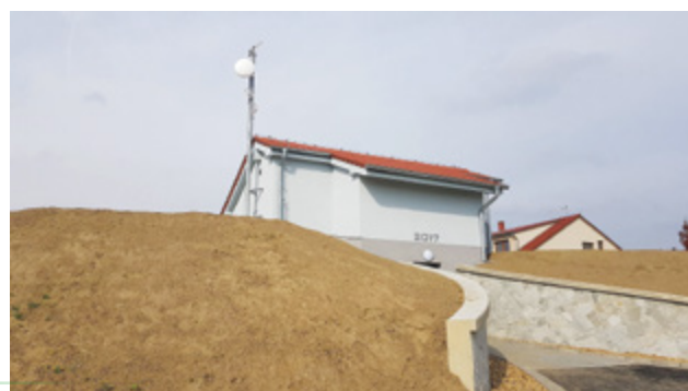
Rozšíření vodojemu Zbýšov, dotace: 6 677 900 Kč