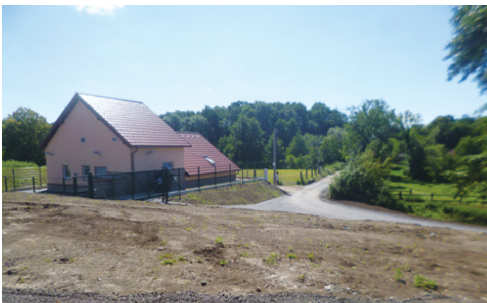
Podolanka – kanalizace a ČOV, dotace: 46 122 105 Kč