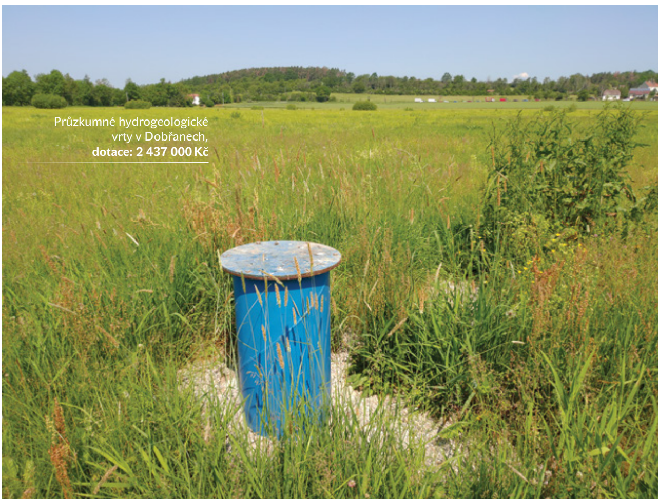
Průzkumné hydrogeologické vrtu v Dobřanech, dotace: 2 437 000 Kč