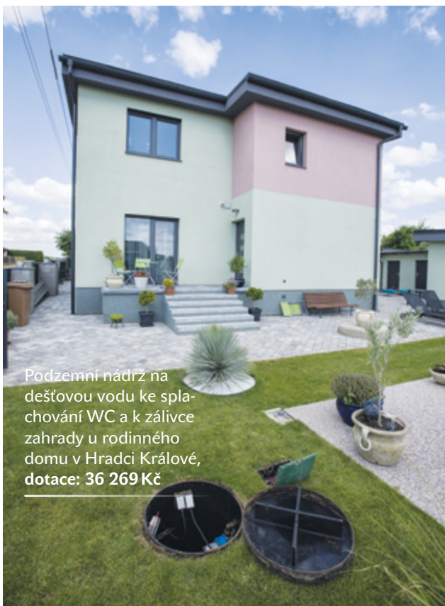
Podzemní nádrž na dešťovou vodu ke splachování WC a k závlivce zahrady u rodinného domu v Hradci Králové, dotace: 36 269 Kč