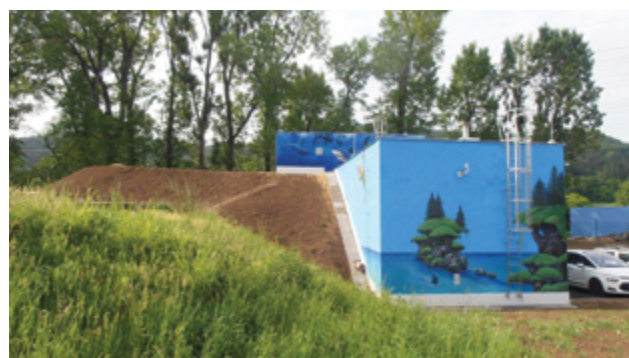
Čebín Podhájí – modernizace úpravy vody a zvýšení kvality zdroje pitné vody, dotace: 15 124 270 Kč