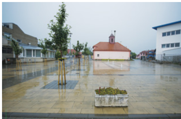
Hospodaření se srážkovými vodami na náměstí v Moravském Písku, dotace: 1 067 907 Kč