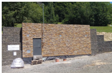
Jilemnice – zkapacitnění vodního zdroje Bátovka, dotace: 19 376 887 Kč