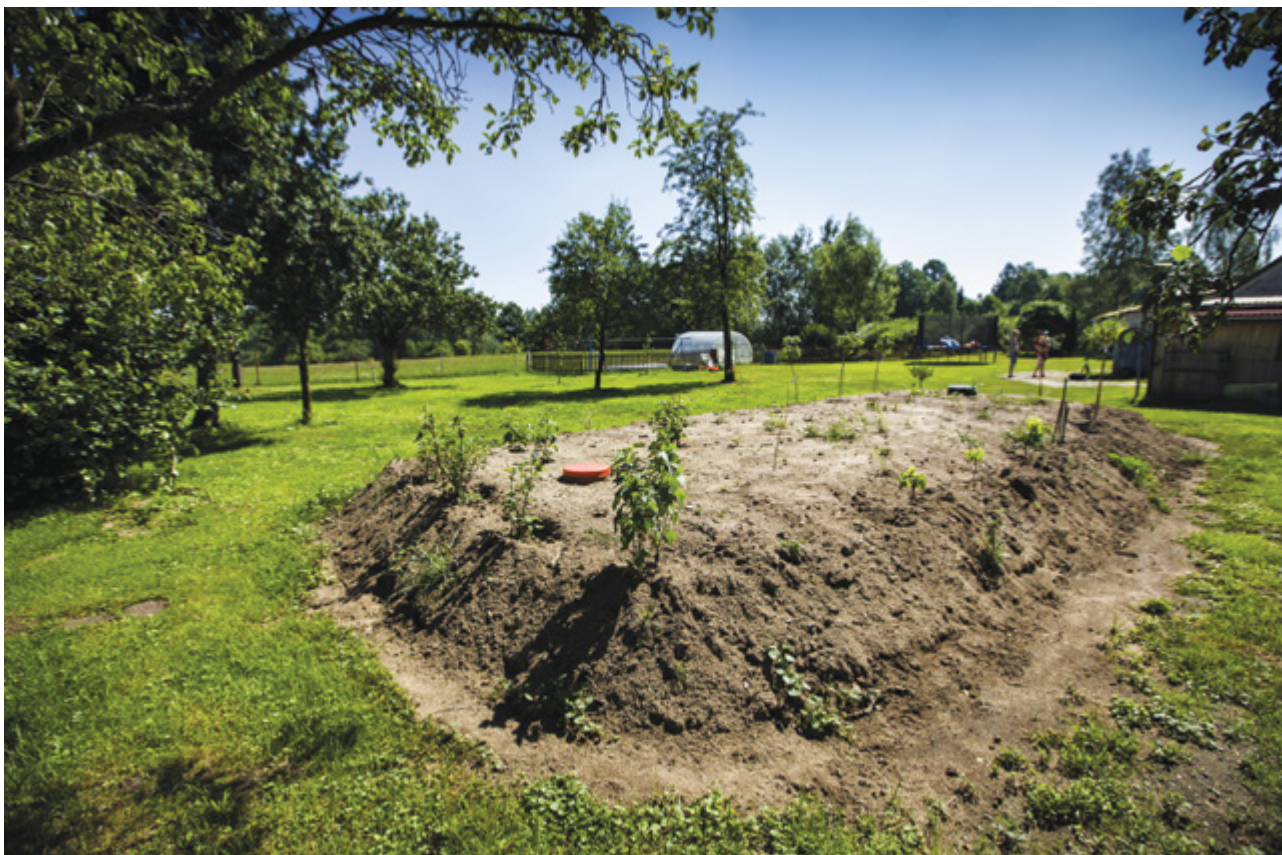
Čištění odpadních vod v obci Dvory nad Lužnicí, dotace: 1 270 000 Kč