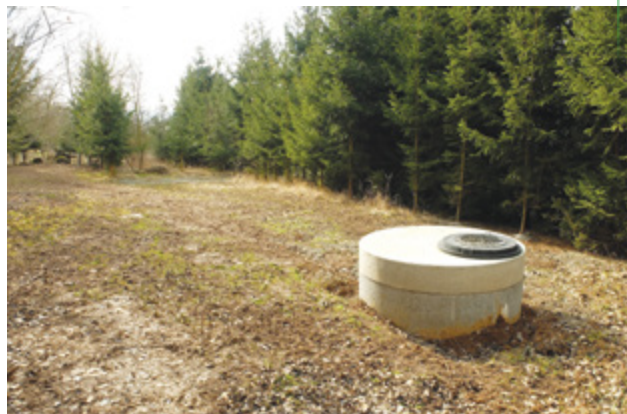
Hydrogeologický průzkumný vrt pro obec Vážany, dotace: 242 484 Kč