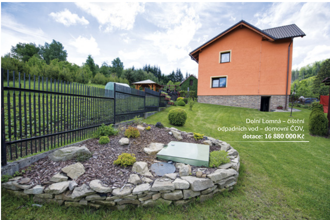
Dolní Lomná – čištění odpadních vod – domovní ČOV, dotace: 16 880 000 Kč