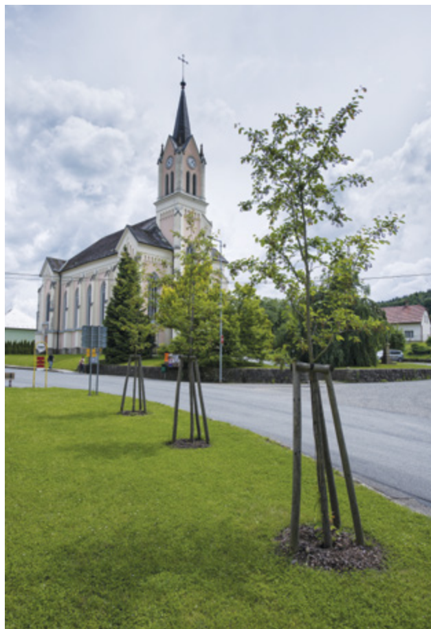
Revitalizace zeleně v centru obce Vidče, dotace: 580 348 Kč