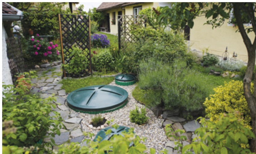
Paceřice – likvidace odpadních vod, dotace: 4 460 000 Kč