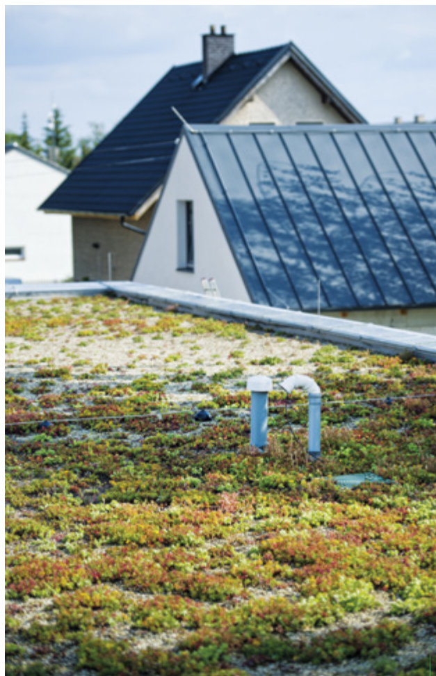
Nový rodinný dům se zelenou střechou v Úhonicích, dotace na zelenou střechu: 123 874 Kč