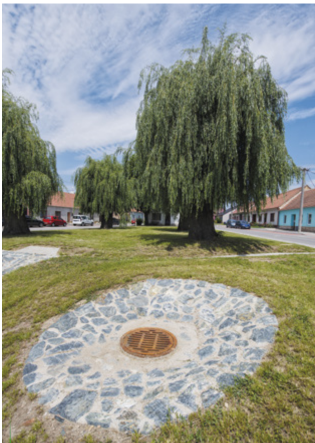
Přísnovice – Lokalita Za Kostelem, Hospodaření se srážkovými vodami, dotace: 5 688 420 Kč