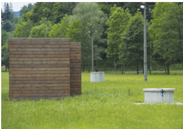
Vyhledání a průzkum zdroje podzemních vod pro obec Zahradky, dotace: 228 218 Kč