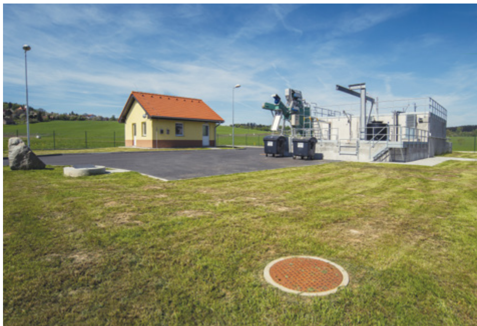
Výstavba kanalizace a nové ČOV v Plánici, dotace: 25 907 394 Kč