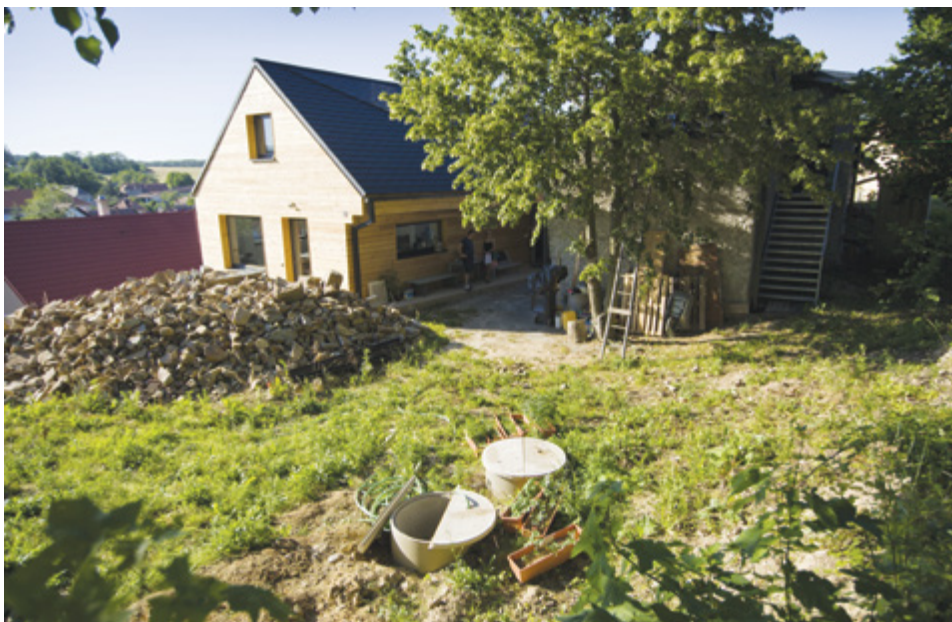
System na využívání přečištěné odpadní a dešťové vody v Kostelci u Heřmanova, dotace: 105 000 Kč